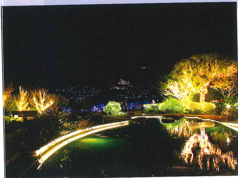
グラバー園 (旧三菱第二ドックハウス前)