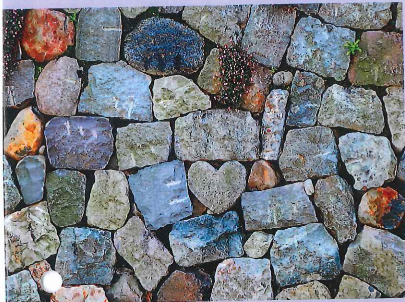
長崎幸福のハートストーン